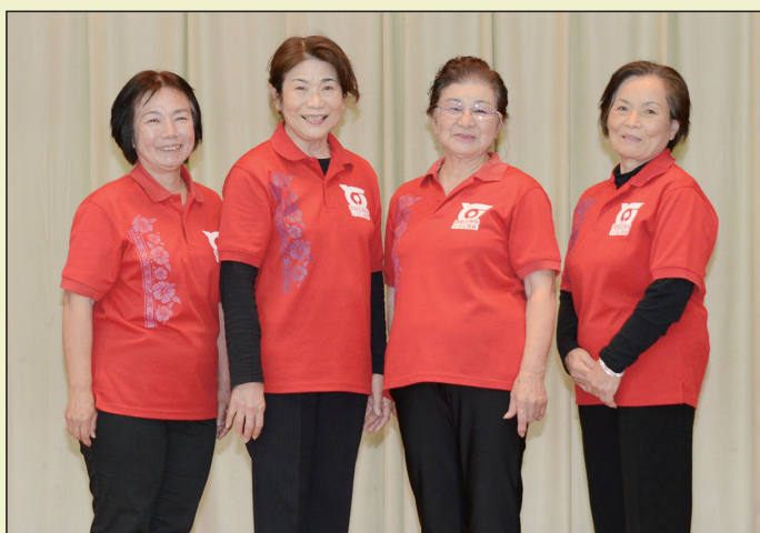
いぶし銀会新役員（左から）会計、副会長、 会長、書記