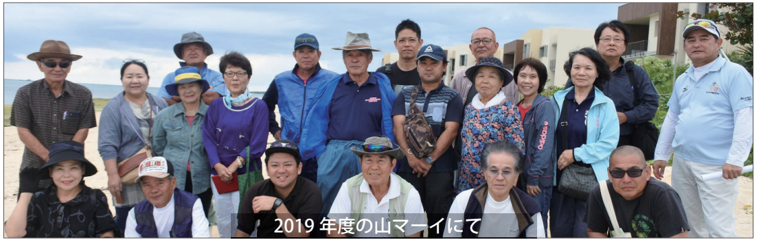
2019 年度の山マイにて