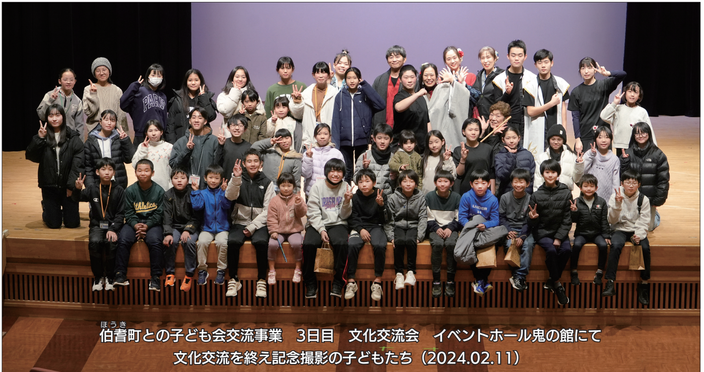
ほっさき 伯耆町との子ども会交流事業 3日目 文化交流会 イベントホール鬼の館にて 文化交流を終え記念撮影の子どもたち (2024.02.11)